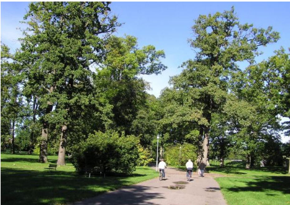
Tilgang til grøntområder er viktig for en skole i dag. Her fra Lystlunden.