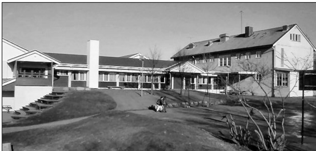
Det er behov for utvidelse av Granly skole relativt raskt

Arbeidsgruppen mener videre at alternativ A med 3 paralleller på Granly og Lillås er den beste løsning basert på økonomi og pedagogiske vurderinger. Det er behov for en rask utbygging av Granly, med byggestart for eksempel i 2010. Videre må Sentrum skole stå klar til skolestart i 2012. Utbygging av Lillås prioriteres i denne sammenheng etter Granly og Sentrum. Vi vil her vurdere behovet for utvikling på et senere tidspunkt, sett i lys av enda sikrere tall for framtidig elevutvikling.